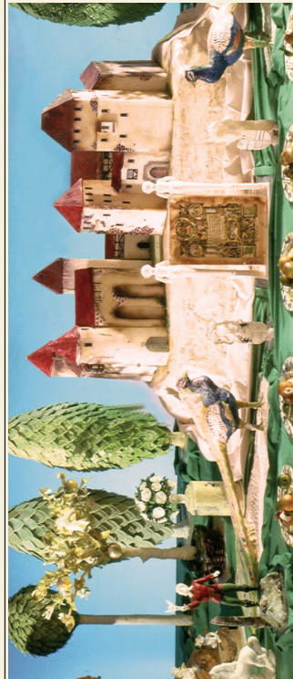
Detail aus dem «Zuckerbankett» nach der Hochzeit von Jacobe von Baden und Kurfürst Johann-Wilhelm zu Jülich-Kleve-Berg 1585 < Gesamtumfang 20 qm >