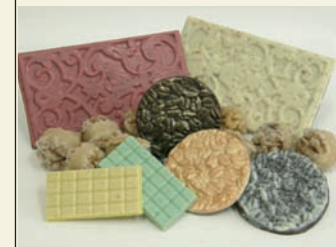
Schokoladen und Pralinen nach Firmenmotiven