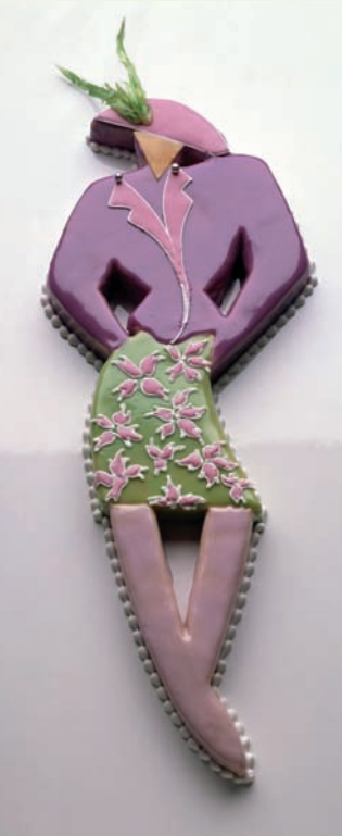
Baumkuchentorte mit Zuckerguss