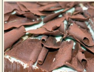
Exquisite Torten - auch nach individuellen Kundenwünschen